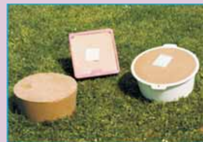
L 001 - Kamenná krmná sůl 1 balení = 50kg(pytel)